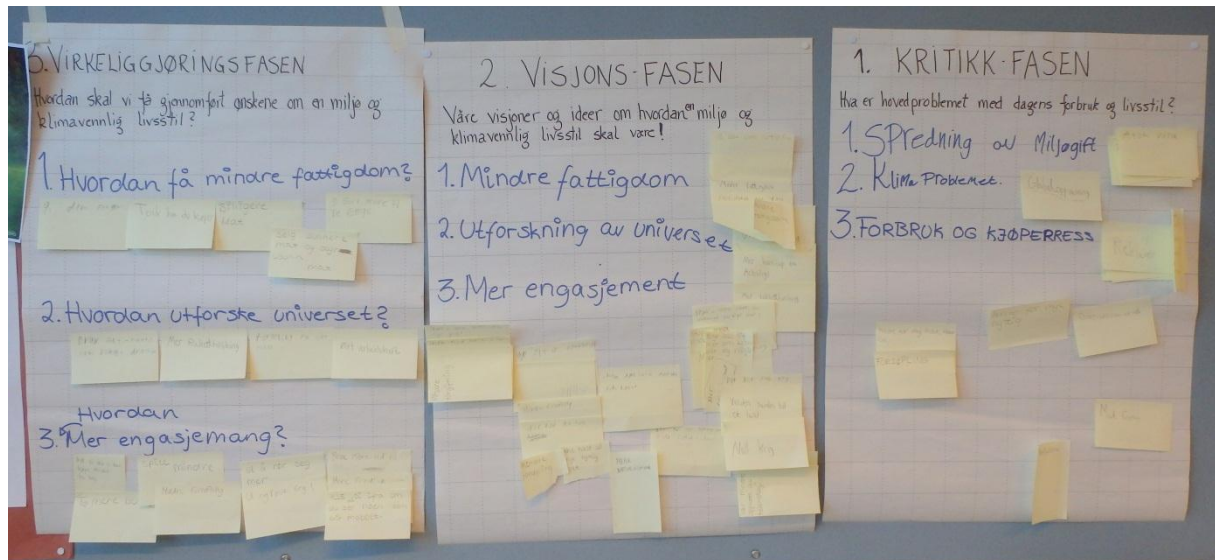
Resultat fra elevenes arbeid i Tankesmia.

de i oppgave å beskrive hvordan de virkelig ønsker at samfunnet rundt seg skal være til beste for seg selv, sin egen helse, og for miljø og klima. Siste fase i tankesmien er virkeliggjøringsfasen – og her blir de utfordret til å vise hvordan visjonene og ønskene kan settes ut i livet, og hva som evt. kreves for å få det til.