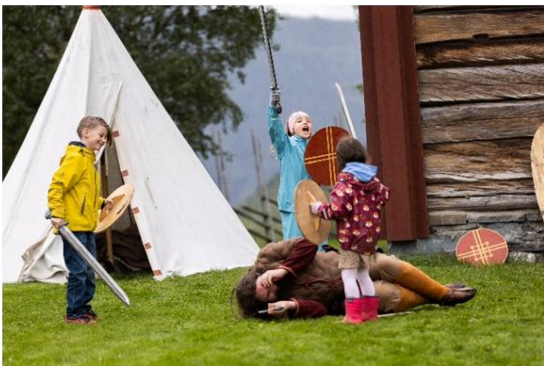
Figur 5: Krigerskole med Trondheim Vikinglag under Sagauka i 2023. Et eksempel på levende formidling ved Horg Bygdatur.

Konseptet med levende formidling kan med fordel utvides til andre praksisområder og tidsepoker, som blant annet gårdslivet i førindustriell tid. Det er da tilrådelig å tilrettelegge de bygningene som museet har for formidling og deltagelse fra skoleelever og annet publikum.