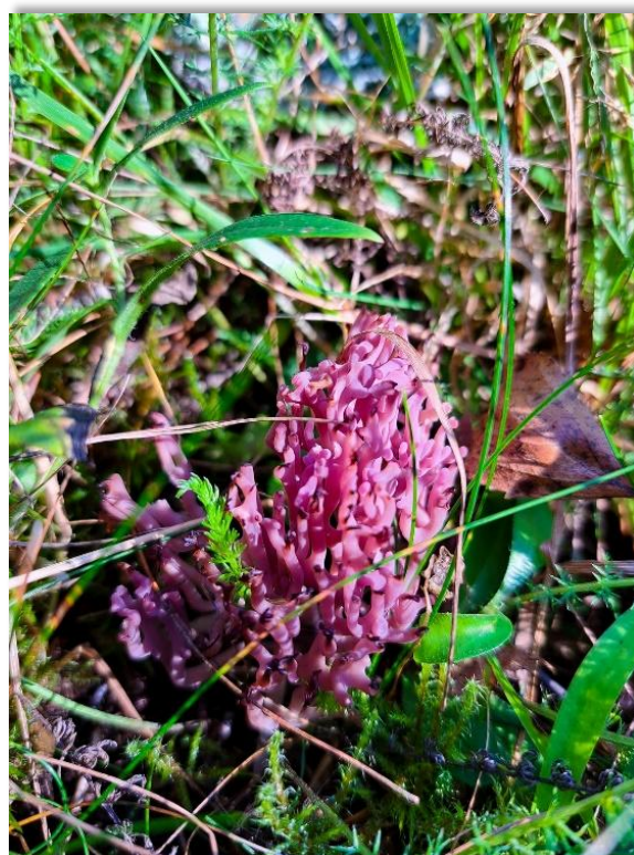
Figur 8: Den rødlistede arten fiolett greinkøllesopp ( Clavaria zollingeri ) dukket opp i det gamle beitelandskapet noen år etter oppstart av landskapsrestaurering og beitebruk.

Begge deler kan være dekkende, da utendørsarealet har vært prioritert i mange år. Det ble i 2024 utarbeidet en skjøtselsplan 47 for Horg Bygdatun (utført av Biofokus på oppdrag fra Melhus kommune). Den har kartlagt de ulike naturtypene på området, samt artskartlegging. Denne planen er et ledd i en landskapsrestaurering med omlegging fra plen og monokultur til tradisjonelle naturtyper som slåttemark, naturbeitemark og hagemark. Samtidig fjernes uønskede fremmedarter som er tilplantet i nyere tid. Gressklipper er delvis erstattet av innleide beitende geiter. Beitebruken er et viktig element i prosessen med restaureringen av gamle naturtyper. Skjøtselsplanen redegjør grundig for de biologiske kvalitetene på området, og gir konkrete råd om hvordan skjøtsel bør utføres. Stedet driftes i dag etter en grunntanke om samspillet mellom natur og kulturmiljøer. Det unike med museumsområdet og landskapet rundt er spennet og mengden kulturminner som viser menneskelig tilstedeværelse på en periode over flere tusen år. Jordbruk og fangst er representert i svært mange av disse.