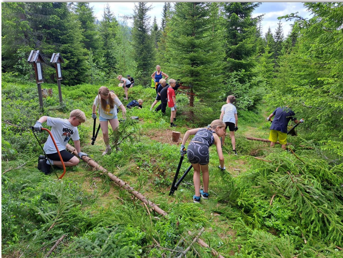
Figur 13: Fra prosjektet «Rydd et kulturminne». 5.klassinger fra Hovin skole i gang med å rydde rundt fangstgropa i natur- og kulturstien.

kulturmiljø i Trøndelag 2022 – 2030 52 . Der er Foss bergkunstlokalitet med i utvalget over regionalt og nasjonalt verneverdige kulturmiljø.