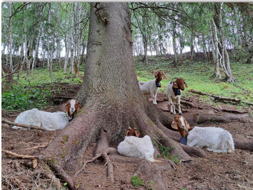
Fig 3: Innleide boergeiter gjør jobben som landskapspleiere, og er et viktig innslag i skjøtselen på Horg Bygdatun.