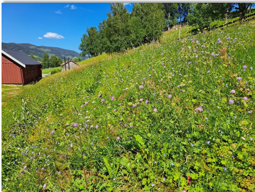
Fig 4: Blomstereng på gammel slåtte­mark

I Kommunedelplan for miljø og naturmangfold 6 er følgende delmål og tiltak relevante for Horg Bygdatun: