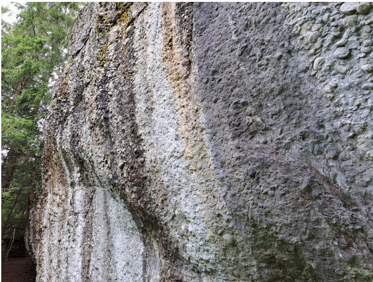
Figur 9; Konglomeratblotning under Skogberget i natur- og kulturstien

I beitesesongen møter publikum geiter på museumsområdet, og den nordlige halvdel av natur- og kulturstien går gjennom områder der ungfve fra nærliggende gårder beiter fritt på inn- og utmark. På vandringen over Fossplatået veksler naturtypene og gir oss direkte erfaring med dynamikken i et levende landskap der natur og kultur er uløselig sammenflettet. Det mosaikkpregede landskapet gir grunnlag for en variert flora og fauna som beriker friluftslivet.