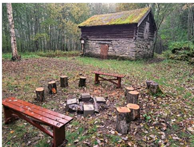
Figur 6: Tilrettelegging for aktiv formidling og uteskole ved husmannsplassen Brekkberget på Foss.

I nærmiljøet til Horg Bygdatun er det svært mange kulturminner og geolokaliteter som med fordel kan formidles via et museum som organisatorisk infrastruktur. Det dreier seg om blant annet bygdeborger, hulveger, jernvinneanlegg, bautasteinlokalteter, gravhauger, kullgroper og fangstanlegg, samt en omfattende samling bergkunst. Det siste kan også anses å utgjøre et eget kulturmiljø 16 . Bergkunsten i Horg omfatter ristninger som kan assosieres med både jordbruk, fangst og fiske.