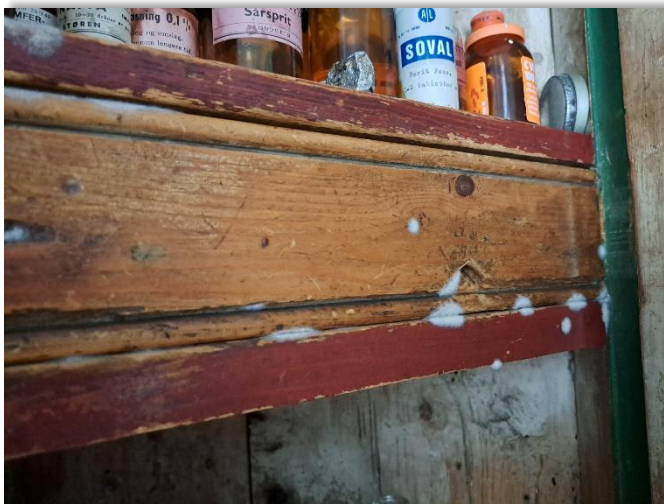
Figur 10, 11 og 12: Bildene illustrerer et eksempel på hva som kan skje når muggsopp når museumsgjenstander. Kråskap i våningshuset hadde angrep av mugg, påvist oktober 2023. Det var også tilløp til muggangrep i et skatoll. Årsaken var svært fuktige forhold i kjeller.