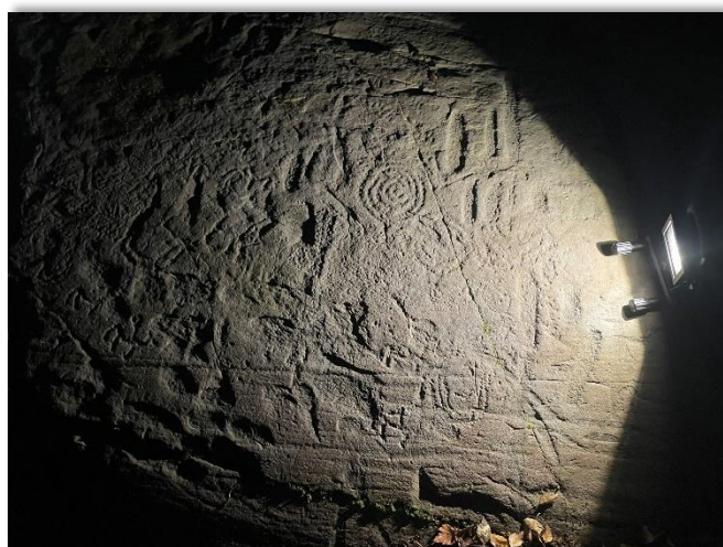
Fig 2: Nattlysing er én av flere teknikker som brukes under dokumentasjon av bergkunst, men metoden er også veldig virkningsfull i formidlingssammenheng.