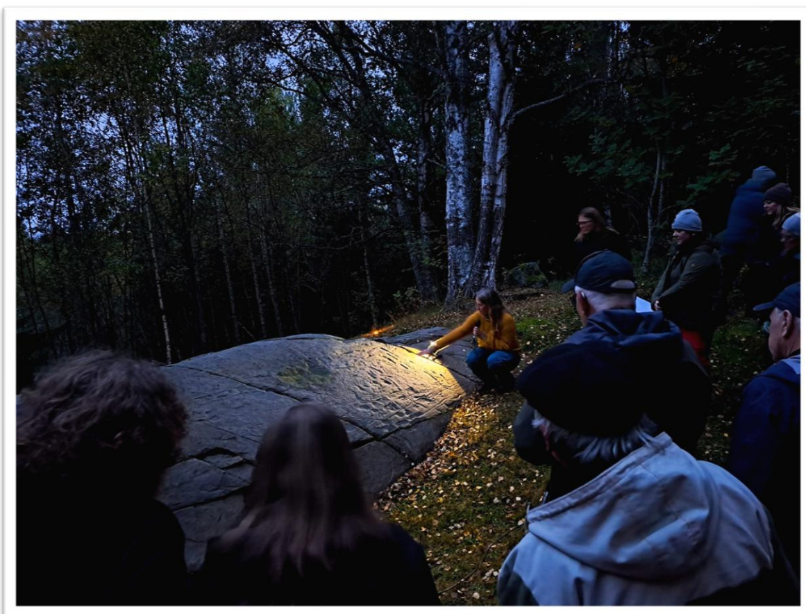
Fig1: Nattlysing av bergkunst på Fosshaugan under Sagauka 2024 med Heidrun Stebergløkken fra NTNU.

«Viktige naturressurser, deriblant mineralressurser og byggeråstoff, sikres med hensynssoner i kommuneplanens arealdel. Viktige kulturminner og attraktive kulturmiljøer sikres i kommuneplanens arealdel». (s. 64).