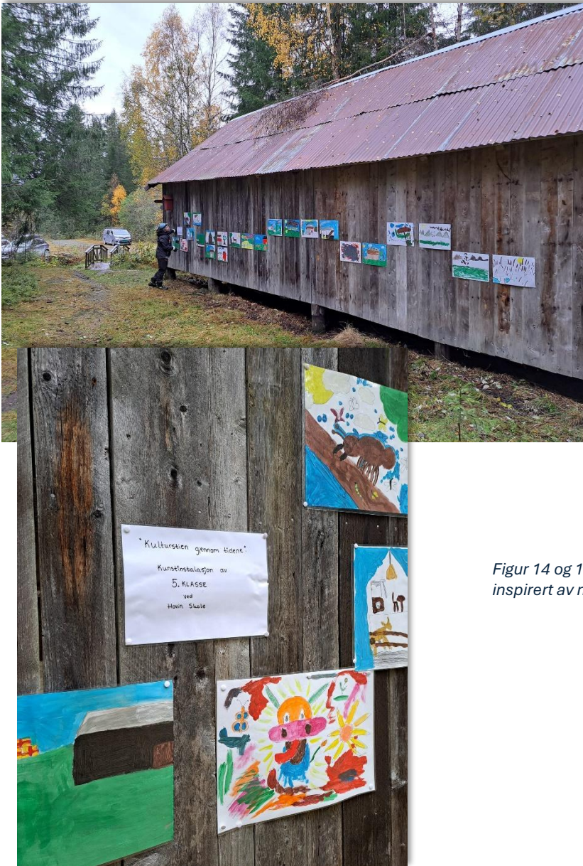
Figur 14 og 15:: Barnekunst på Evjensaga, inspirert av miljøet i natur- og kulturstien.