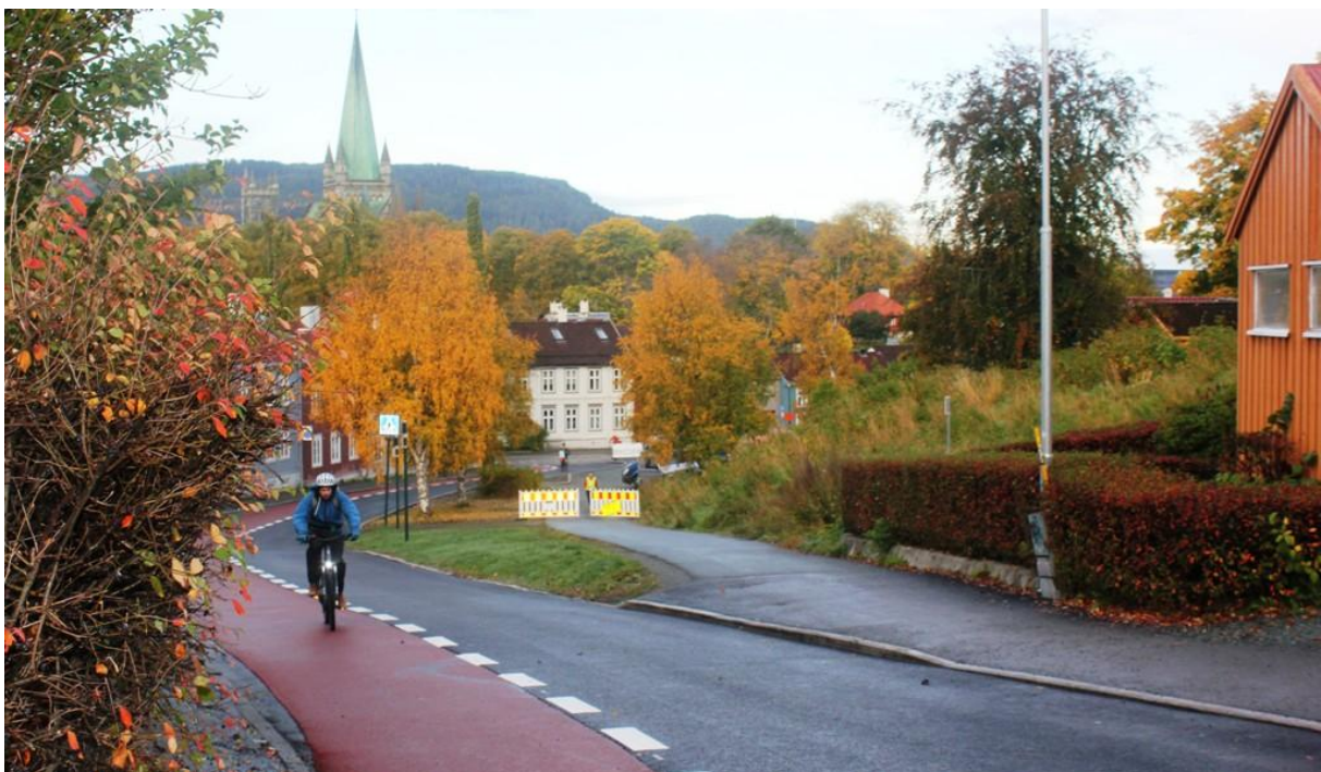
Sykkelfelt i Lillegårdsbakken (bildet) er ferdig. Kun finish gjenstår ved knutepunkt på Tiller (City Syd).

Toget som nav: Alle fire kommuner planlegger utvikling av jernbanestasjonene som effektive knutepunkt. Her skal det investeres store beløp på Trondheim S, i Melhus sentrum, ved Hommelvik stasjon og i Stjørdal sentrum.