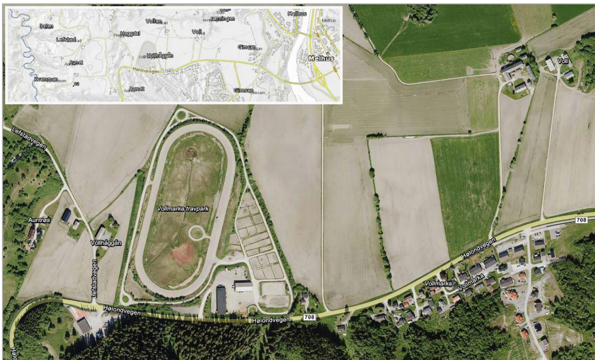
Figur 1 Oversiktskart over Vollmarka

Planområdet strekker seg langs fv. 708 fra Innleggsvegen og til Holondvegen 260 (avkjøring til Lefstadvegen), en strekning på ca. 850 meter. Hovedstrekningen for fylkesvegen har gårds- og bruksnummer 1708/4.