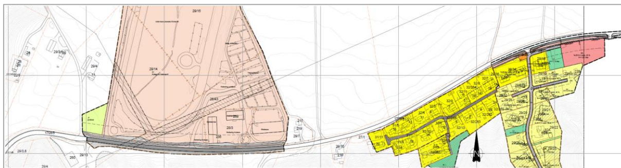
Figur 2 Gjeldende reguleringsplaner i området

Reguleringsplan Vollmarka har hovedformål bolig, og har regulert inn gang- og sykkelveg på sørsiden av fylkesvegen. Foreslått tiltak vil bli en forlengelse av denne gang- og sykkelvegen.