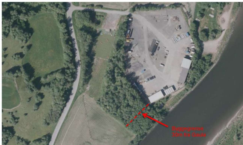
Bilde 2: viser dagens bruk av området. Rød, stiplet linje viser planforslagets avsettelse av byggegrense for å sikre en 30m grøntbelte som bevaring av naturområde mot Gaula.

Aktuelt firma får da mulighet til å videreutvikle sin virksomhet innenfor planområdet, og firmaet slipper å flytte sine virksomheter ut av Melhus kommune.