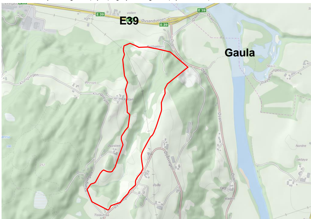
Figur 1 Planområdets lokalisering

I henhold til plan- og bygningsloven §§ 12-8 og 12-9 varsles det nå at det er satt i gang arbeid med detaljregulering med konsekvensutredning for eiendom Øyan 370 m. fl. Planen omfatter deler av gnr./bnr. 2/1, 2/2, 3/1, 4/1, 4/2, 6/1, 6/2, 6/8 og 8/5 i Melhus kommune. Planområdet er lokalisert på Udduvoll ved fylkesveg 735 (Øyan) og Fylkesveg 734 (Øyåsbakkan).